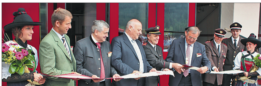
Le tai dla vèta da pert dles autoritès dan le magazinn di Stödafüch.

La vijinanza da Costa à baiè sura l'importanza dl punt y à rengraziè le Comun de Badia arjignan ca n pice renfrèsch. Le punt à costè 1.800.000 Euro, de chisc n miliun é gnüs finanzia da pert dlla Provinzia; le punt é gnü fat sö da n dita da Pordenone y mosöra indöt 92 m. Le Landes-